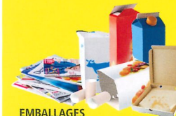
EMBALLAGES EN PAPIERS & CARTONS