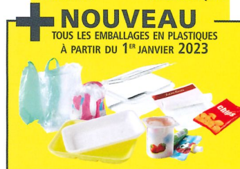
EMBALLAGES EN PLASTIQUES

+ NOUVEAU TOUS LES EMBALLAGES EN PLASTIQUES À PARTIR DU 1 er JANVIER 2023