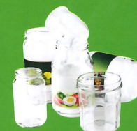
POTS ET BOCAUX EN VERRE