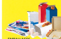
EMBALLAGES EN PAPIERS & CARTONS