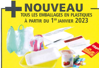
+ NOUVEAU TOUS LES EMBALLAGES EN PLASTIQUES À PARTIR DU 1 er JANVIER 2023