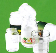
POTS ET BOCAUX EN VERRE