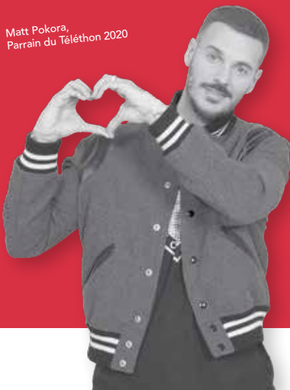
Matt Pokora, Parrain du Téléthon 2020

PARTICIPEZ à une chaîne de solidarité unique au monde